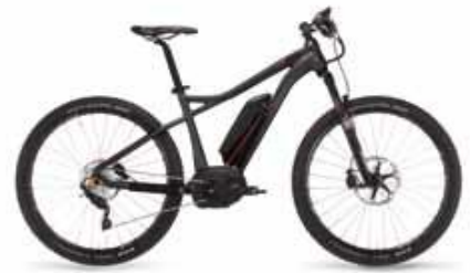
Goroc saphirschwarz matt